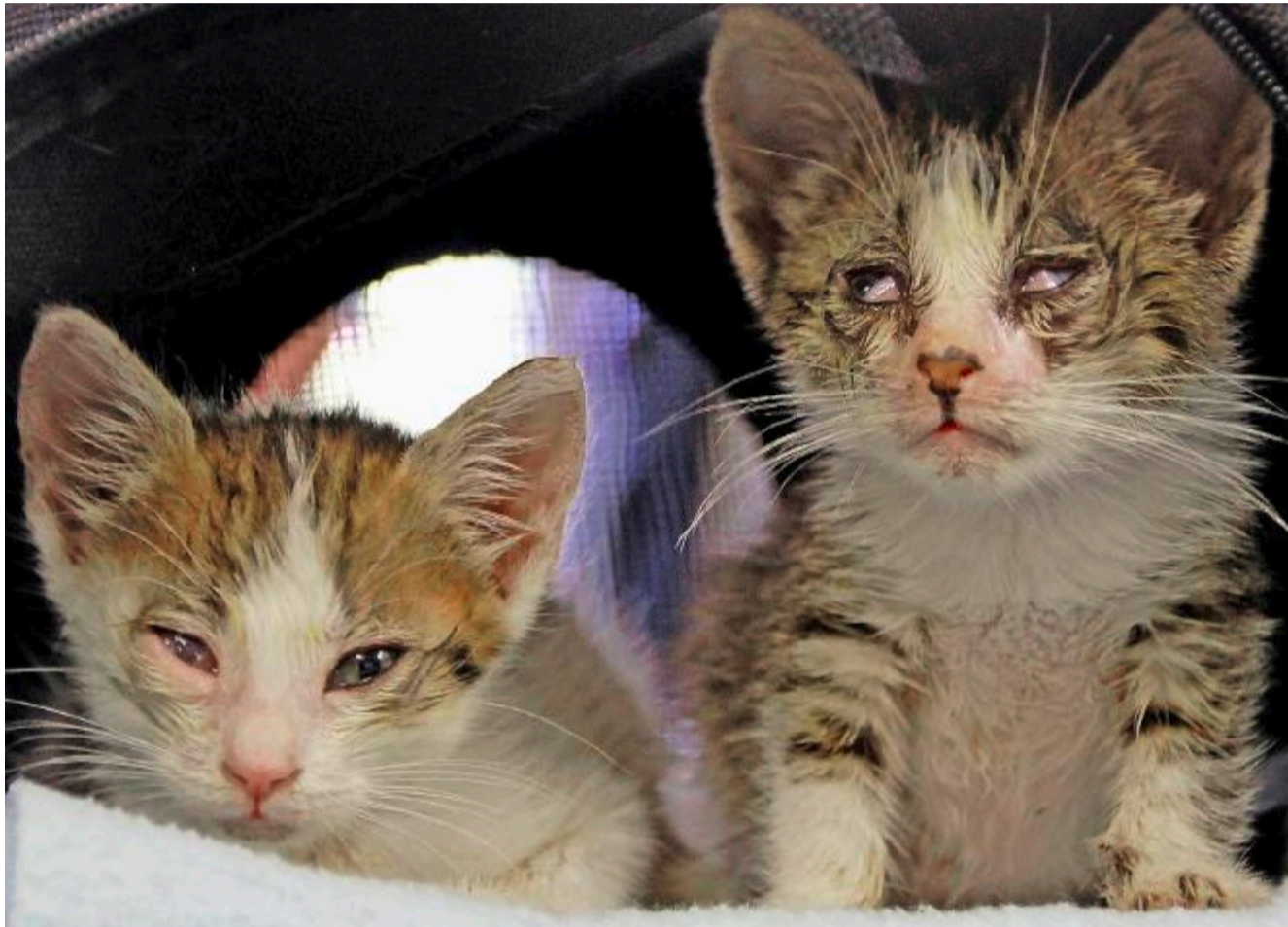
Häufiges Erbrechen und wässriger oder blutiger Durchfall: Zwei mit der Seuche infizierte Kätzchen.

Und wenn es dann irgendwann einmal zu viele Katzen sind, dann würden die Tiere teilweise grausam getötet: Sie würden ersäuft, erstickt, erschlagen, vergast - oder einfach in die Tiefkühltruhe gelegt. Dem einen oder anderen käme da eine dezimierende Katzenseuche sogar gelegen, sagen Tierärzte. Denn sind die Parvoviren erst einmal auf dem Hof, sei